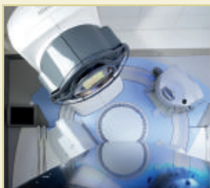
Elekta Agility 160 MLC

Mit dem Hochpräzisionsbeschleuniger Elekta Agility 160 MLC können schnell und präzise sogar komplexe Tumorstrukturen behandelt werden. Mit den in dem Gerät integrierten 160 Wolframlamellen, die je nach Bedarf geöffnet und geschlossen werden können, ist es möglich, den Tumor nachzubilden und akkurat zu bestrahlen.